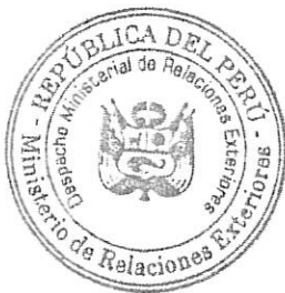
Néstor Popolizio Bardales Ministro de Relaciones Exteriores